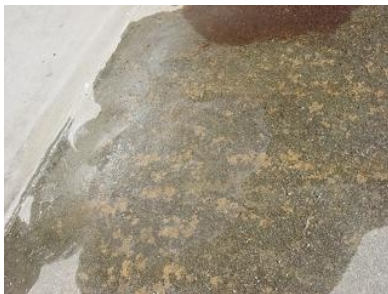
フューゲルST (水はじき無し)