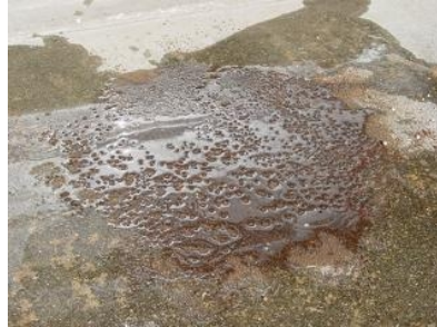
他社製品 (水をはじいている)